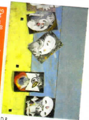
Des collages réalisés dans le cadre d'une visite de l'écrit Topique