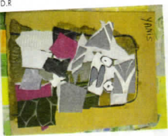
Un Bataclan réalisé lors d'une visite de l'écrit Topique