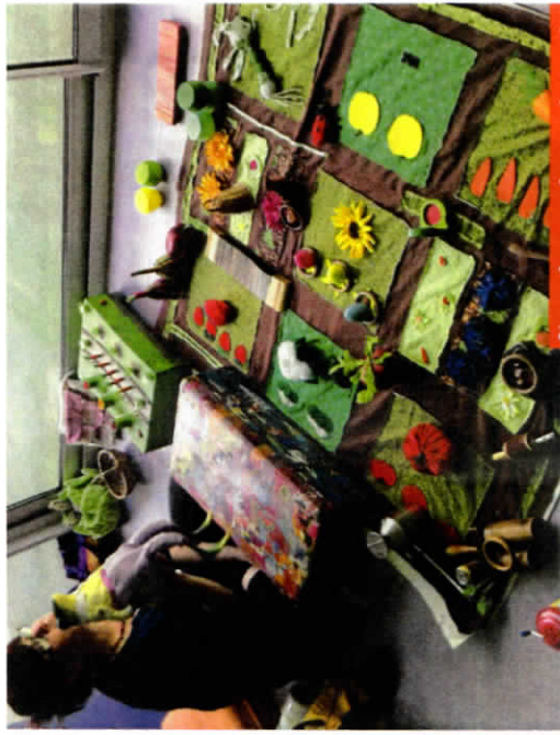
Un atelier d'éveil musical en crèche.

G. B. : Notre but n'est pas l'apprentissage ! Nous voulons offrir aux enfants une multitude d'expériences culturelles avec les livres, les arts plastiques, la musique, la danse... Ils rempliront ainsi leur « petit panier ». Dès la naissance, le tout-petit a d'abord besoin d'une enveloppe sensorielle (voix, toucher, portage), porteur de repères et de sécurité. Peu à peu, une enveloppe culturelle se crée aussi autour de lui. Dans ce qu'on lui adresse, le tout-petit