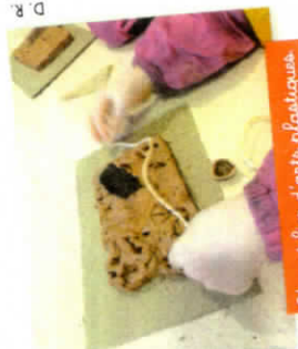
Un atelier d'arts plastiques.